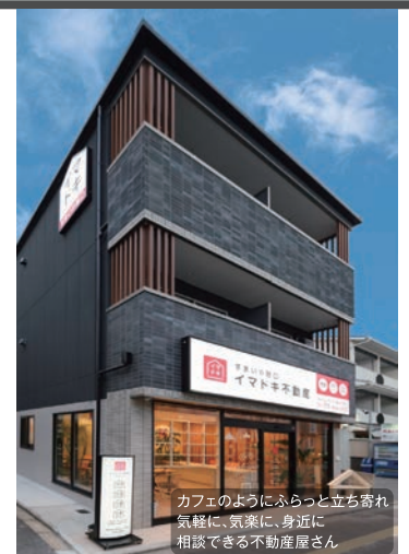
カフェのようにふらっと立ち寄れ 気軽に、気楽に、身近に 相談できる不動産屋さん